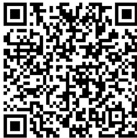
单位会员转账缴费登记表